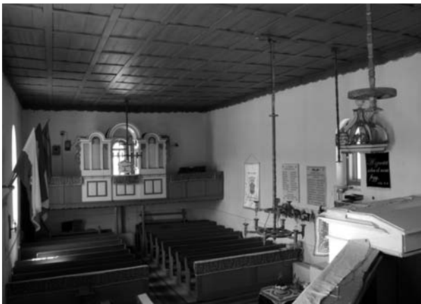
9. kép. A templom részlete az unitáriusok orgonájával.

1923-ban írták le, hogy: „A községben nevezetesebb szokásnak mondható az, hogy őszentendő estéjén a templom előtt összegyűlnek, énekelnek, szavalnak s egy közülök saját maguk által szerkesztett versben bucsuztatja az ő őszentőt s egy másik köszönti az újat.” 51