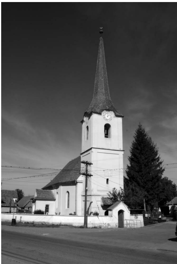
I. kép. A fiatfalvi templom