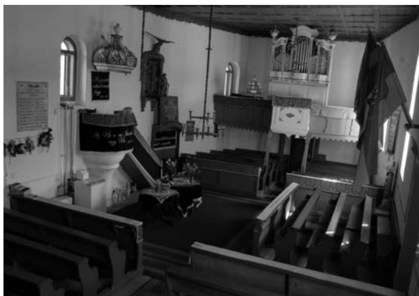
8. kép. A templom részlete a reformátusok orgonájával.