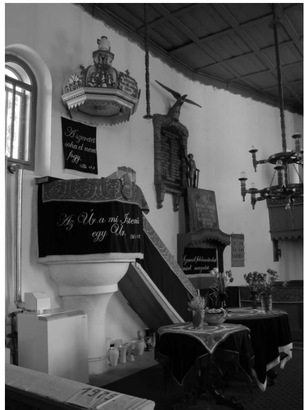
10. kép. A templom piaca a két szószékkel.