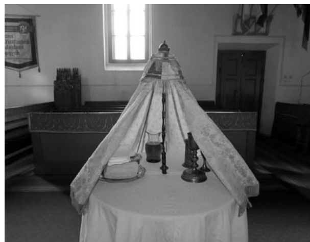
3. kép. A református böjtfői úrvacsoravételre előkészített sátor.