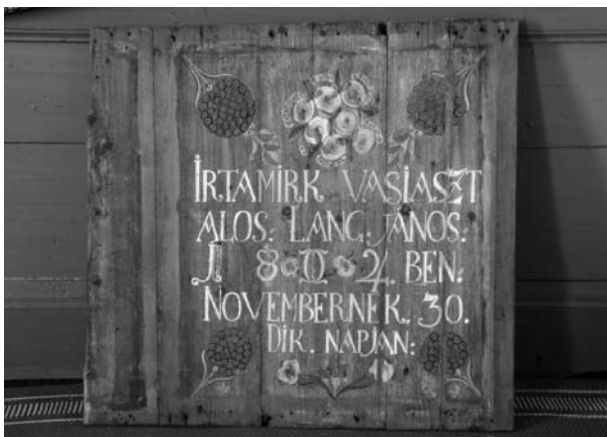
4. kép. A Domokos Levente által restaurált egyik kazetta. (VASS Erika felvétele, 2015.)

Jegyzés Ezen templom közös az itteni Ev. Reformatus Atyaikkal... czinteremnek mostani kerítése cserefa saszakkal készült deszka kertből áll, a' két Eklésia költségén épülvén ez is – valamint a' templom' és torony is.” 35